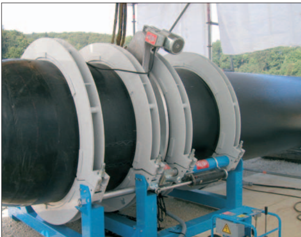
Bild 2: Beispiel einer HS-Schweißmaschine im Einsatz auf einer Baustelle in Süddeutschland