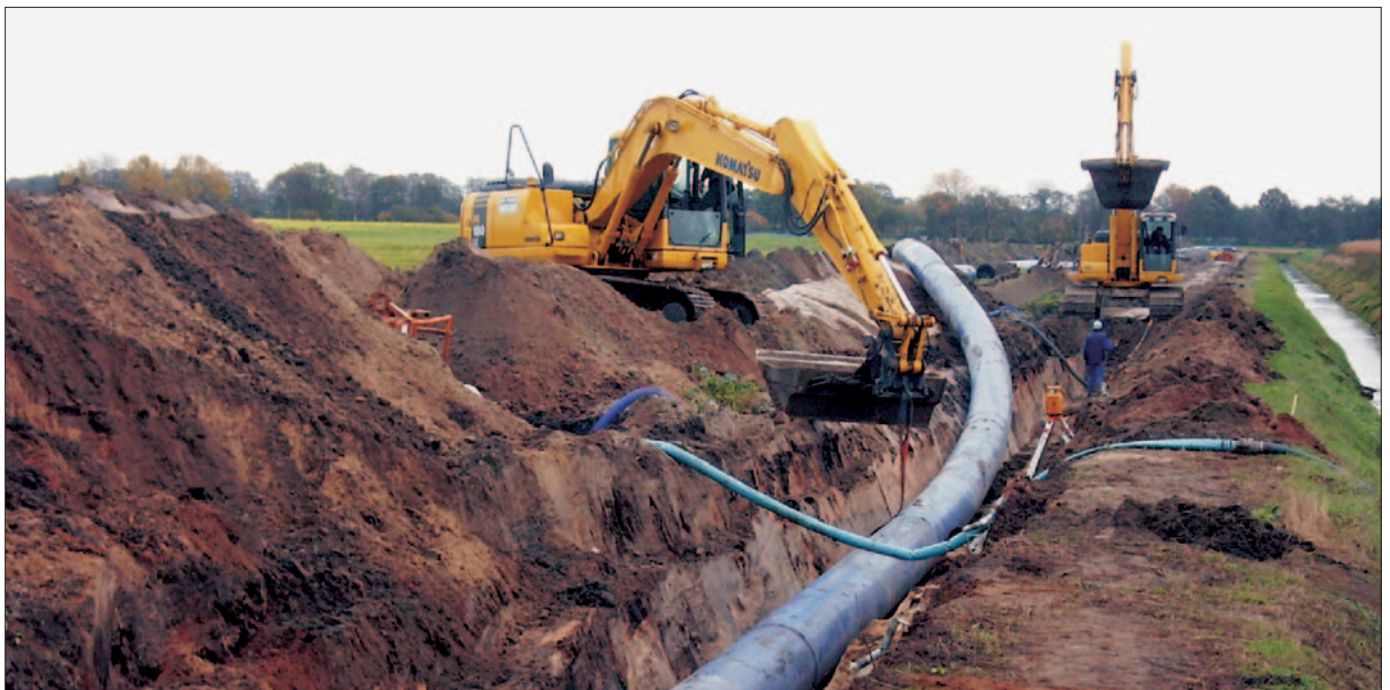
Fig. 1: Installations of a HDPE pipe string (PE 100), d 710 mm

Bild 1: Einbau eines PE-HD-Rohrstrangs (PE 100) d 710 mm