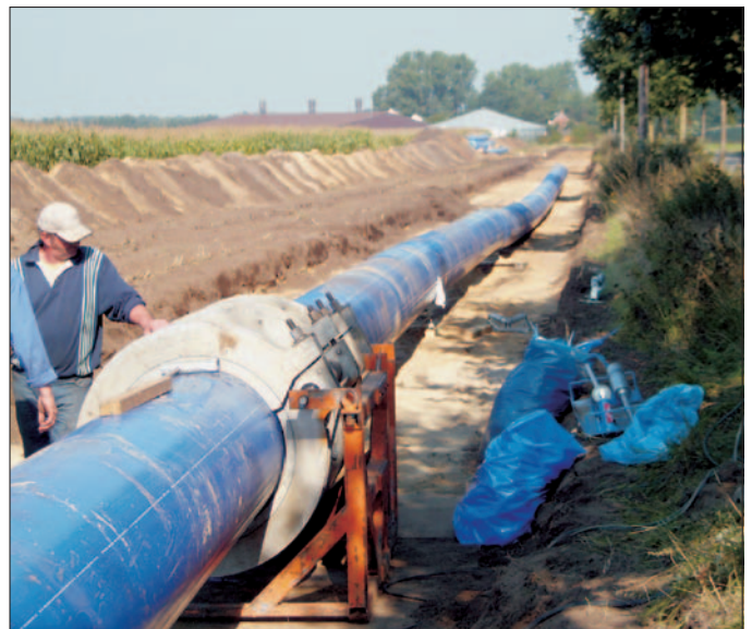
Fig. 5: Welding of two prepared pipe strings